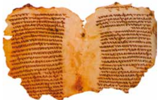
Koloński kodeks Maniego (fragment)

na podstawie: Ł. Kamykowski, Dlaczego Chrystus? Dlaczego Kościół?